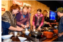
Das Zillertal lud rund 30 Journalisten, Blogger und Influencer aus Skandinavien zum Kaiserschmarrn-Kochen in den TirolBerg Are.