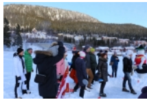
30 Journalisten, Blogger und Influencer aus Skandinavien hatten ihren Spaß bei der schwedischen Eisstock-Premiere die das Zillertal organisierte.