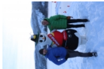
(v.l.n.r.) Die Bergsteigerlegenden Veikka Gustafsson aus Finnland und Peter Habeler aus dem Zillertal