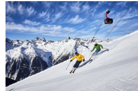
📷 Ischgl verschiebt den Winterstart 2020/21