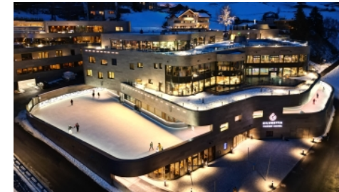
📷 Neue Eislaufbahn rund um die Silvretta Therme in Ischgl eröffnet