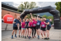
Motiviertes Team von Innsbruck Tourismus beim K7 Business Trail.