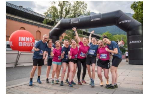
📷 Motiviertes Team von Innsbruck Tourismus beim K7 Business Trail.