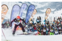
Die Anmeldung zu "Der Weiße Ring - Das Rennen 2024" startet am 29. September um 12:00 Uhr.